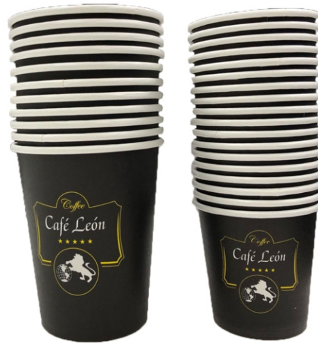
VASOS DE CARTÓN PARA BEBIDAS CALIENTES 120ml y 240ml